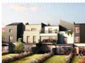
Koncept - Rennes