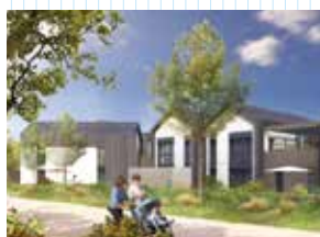
Rythmik - Acigné