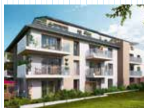
La Kloserie - Saint-Malo