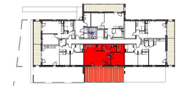
PLAN DU NIVEAU RDC