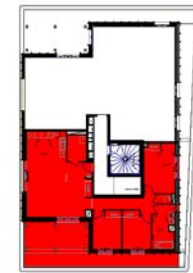
NIVEAU R+7 T4 A7.1